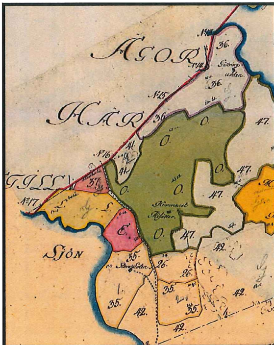
Bild 1. Storskifteskarta 1780. L på kartan beskrivs som Lötängen, en slätteräng som hör till Grytbergs säteri Länsstyrelsen ©Lantmäteriet.

Stora delar av området har tidigare använts som slätteräng. På en äldre karta från slutet av 1600 eller tidigt 1700-talet benämner lantmätare Anders Mörn området som "Löötsängen". Troligen har hävden varit ängsskötsel betydligt längre tillbaka i tiden än så. Ängsskötseln har troligen upphört någon gång under den senare delen av 1800-talet. På härdskartan från sekelskiftet arton-nittionhundratalet (bild 2) kan man se att hävden har övergått till bete.